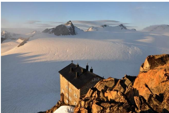
Brandenburger Haus (winter)