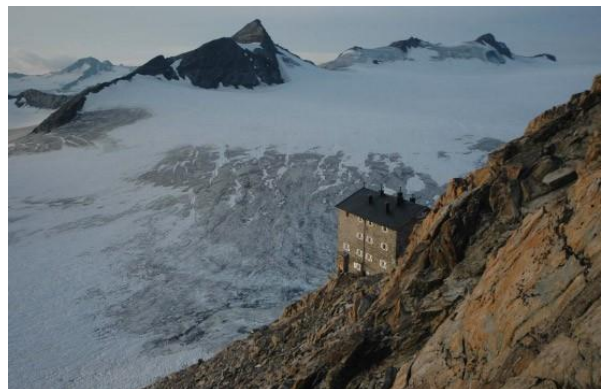
Brandenburger Haus (zomer)