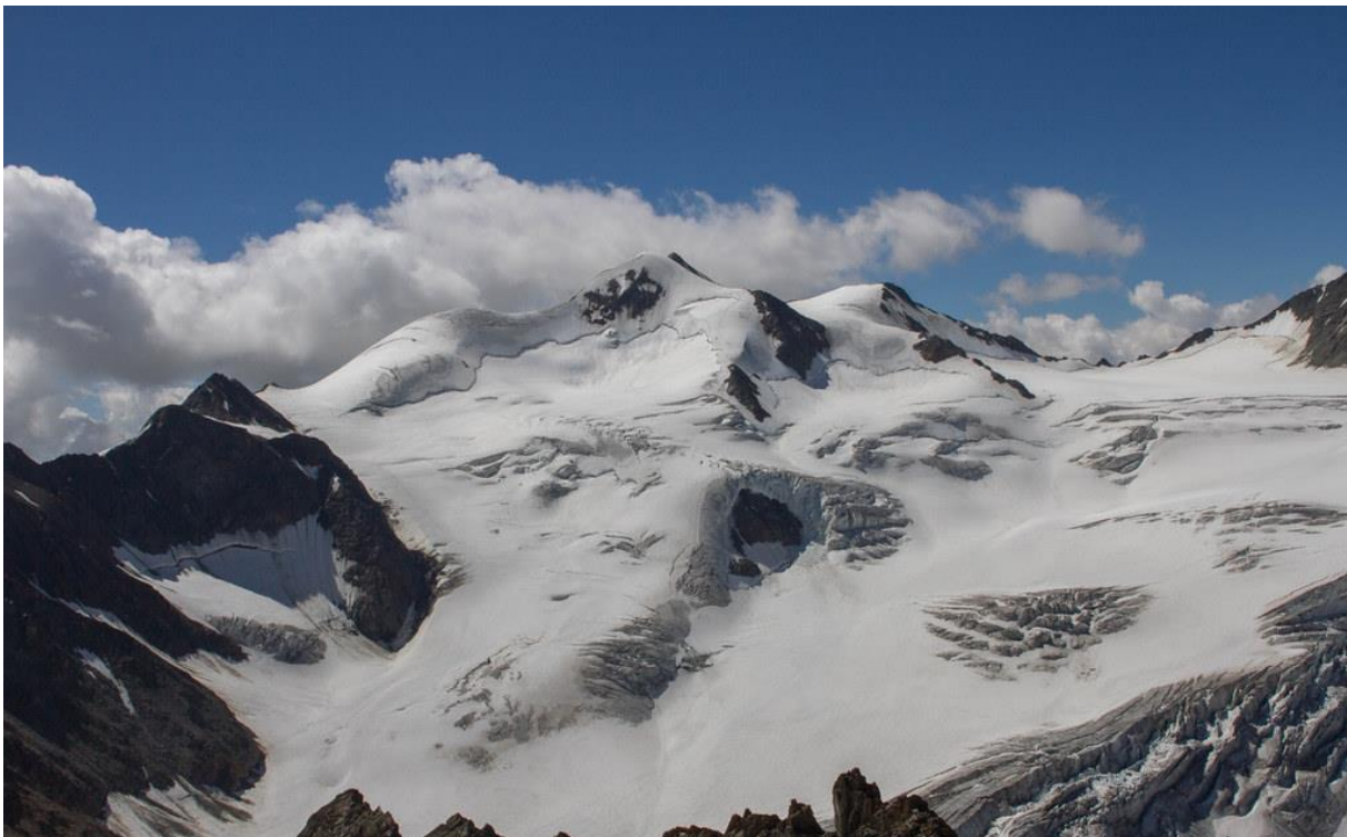
Taschachferner en Wildspitze in winter

Het programma is onder voorbehoud van wijzigingen