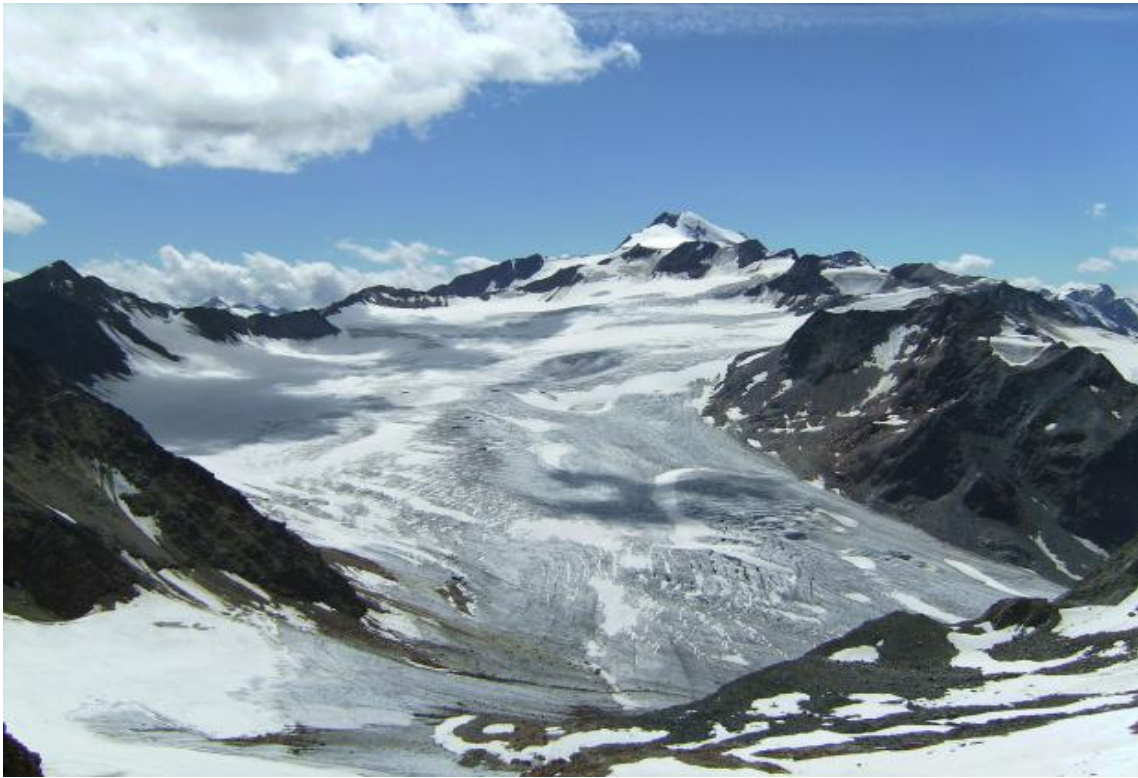
Taschachferner en Wildspitze in zomer

Het programma is onder voorbehoud van wijzigingen