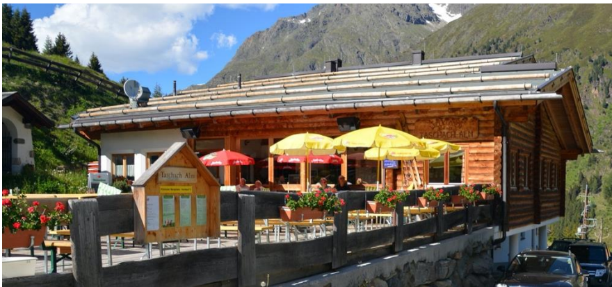
Taschachalm / Taschachalpe

We arriveren vroeg in de middag in het hotel.